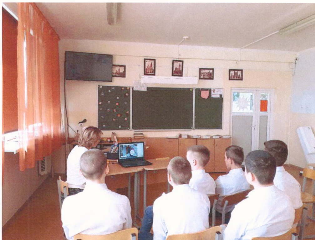
Семинар служб медиации и практические занятия с обучающимися по применению медиативно-восстановительных практик